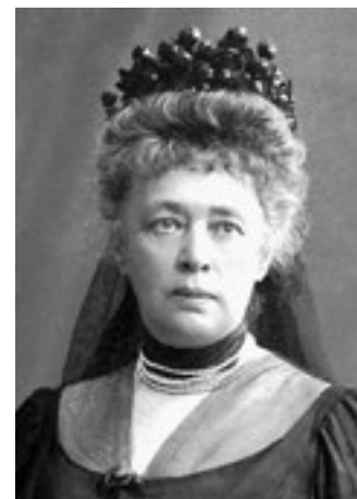
Bertha von Suttner